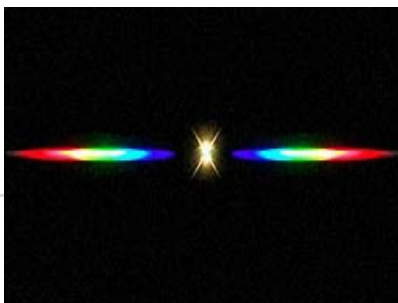
(1) リニア型回折格子500本/mm