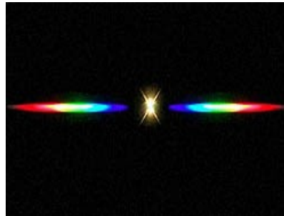
(2) リニア型回折格子1000本/mm